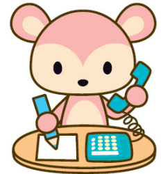
住宅保証機構キャラクター 「まもりす」