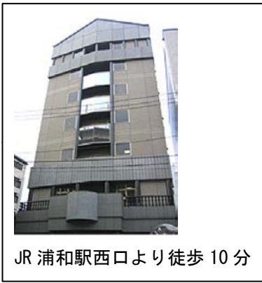
JR浦和駅西口より徒歩10分