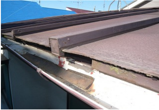
金属板屋根の腐食・変退色